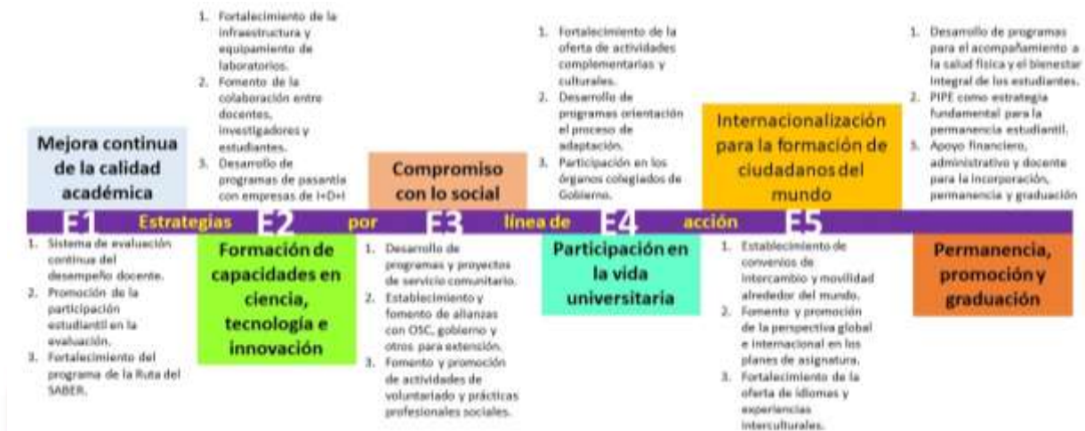
Estrategias de implementación por línea de acción de la política de estudiantes en Unitecnar

Nota: Las líneas de acción proyectadas incluyen la mejora continua de la calidad académica, la formación de capacidades en ciencia, tecnología e innovación, el compromiso con lo social, la participación en la vida universitaria, la internacionalización para la formación de ciudadanos del mundo y la permanencia, promoción y graduación oportuna.